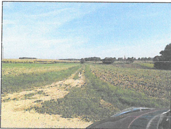
2.kép: Olaszfalu 1 hrsz.-ingatlan

A módosítással változik a településszerkezeti terv (SZE-1) és a szabályozási terv BSZA-2 tervlapja.