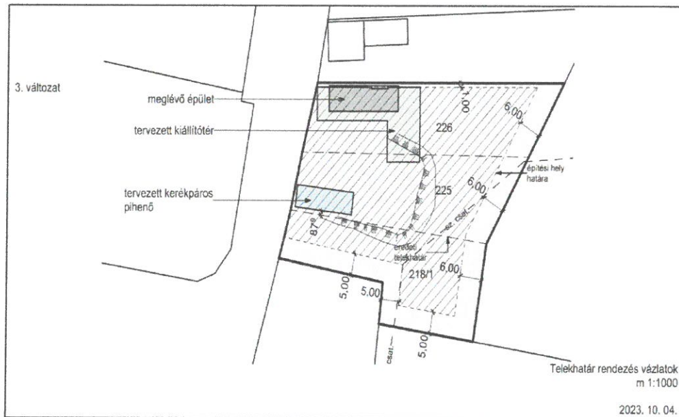
5.kép: Kerékpáros pihenő vázlat terv

A tervezett megvalósíthatósághoz szükséges még a 224 (218/1) hrsz.-ú ingatlanon kiszabályozott építési vonal törlése is.