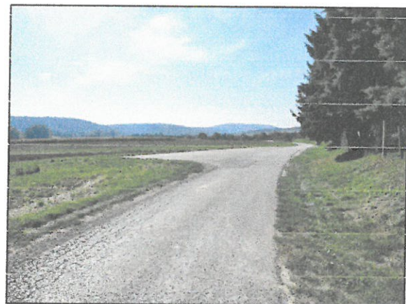
3.kép: Olaszfalu 1-2 hrsz.-ingatlan DNy-i telekhatárán lévő temető felőli parkoló-burkolt út

3. sz. módosítás: Olaszfalu 461 hrsz.-ú ingatlanán található épületek helyi védettségének megszüntetése mellett döntött az Önkormányzat. A Szabályozási terven szereplő helyi értékvédelemre javasolt épület jelölés megszüntetésre kerül, illetve a HÉSZ 2. melléklet 1.