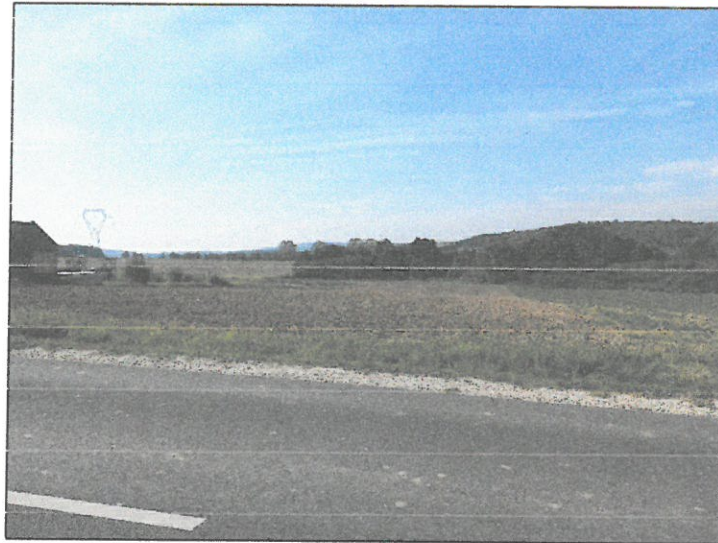
1.kép: Olaszfalu 484 hrsz.-ingatlan (szántó terület)

2. sz. módosítás: Olaszfalu 1 és 2 hrsz-ú ingatlant érintő közlekedési terület szabályozási vonala részben módosításra, részben megszüntetésre kerül.